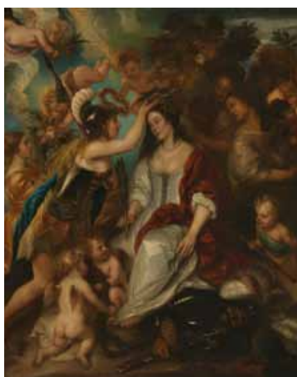
Jan Lievens, Allegorie op de Vrede, 1652, Rijksmuseum

welvaart voor iedereen. Deze zogenaamde portraits-historiés – een portret van iemand als een personage uit de geschiedenis of mythologie – waren mateloos populair aan het hof van stadhouder Frederik Hendrik en Amalia van Solms in Den Haag. Hun dochter Henriëtte Louise van Oranje Nassau (1627-1667) en haar gade de keurvorst Frederik Wilhelm van Brandenburg lieten zich portretteren als Venus en Mars in een intieme pose. Zij naakt en dromerig, hij met een arm om haar heen, een hand op een borst. Zijn wapenrusting wordt ongemerkt weggepikt door twee naakte putti. Het moge verbazing wekken dat de vorstin zich zo vrij liet portretteren, maar het is een rollenspel dat door iedereen werd begrepen. Naaktheid is een attribuut van Venus, net als haar blonde haar. In het