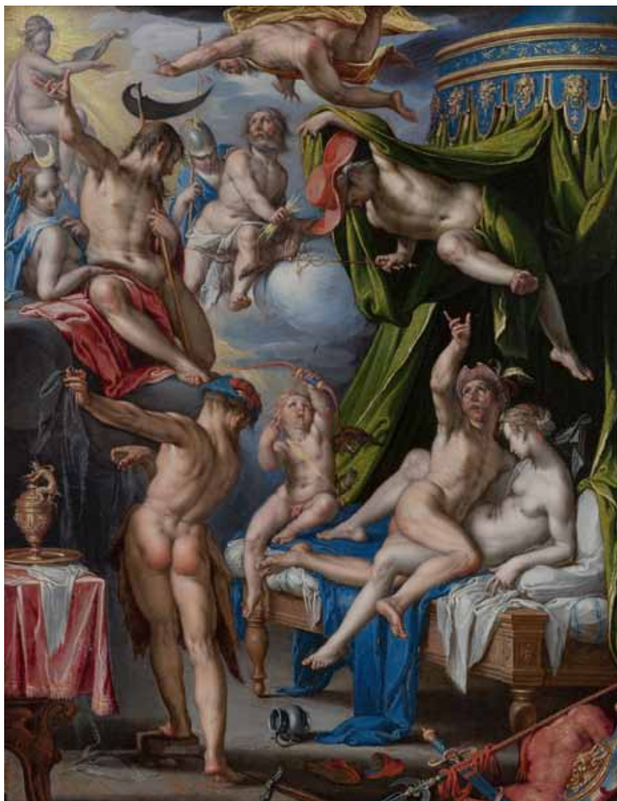
Joachim Wtewael, Venus en Mars betrappt door Vulcanus, 1601, Mauritshuis Den Haag

welvaart voor iedereen. Deze zogenaamde portraits-historiés – een portret van iemand als een personage uit de geschiedenis of mythologie – waren mateloos populair aan het hof van stadhouder Frederik Hendrik en Amalia van Solms in Den Haag. Hun dochter Henriëtte Louise van Oranje Nassau (1627-1667) en haar gade de keurvorst Frederik Wilhelm van Brandenburg lieten zich portretteren als Venus en Mars in een intieme pose. Zij naakt en dromerig, hij met een arm om haar heen, een hand op een borst. Zijn wapenrusting wordt ongemerkt weggepikt door twee naakte putti. Het moge verbazing wekken dat de vorstin zich zo vrij liet portretteren, maar het is een rollenspel dat door iedereen werd begrepen. Naaktheid is een attribuut van Venus, net als haar blonde haar. In het