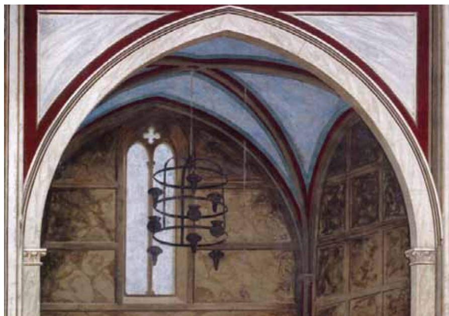
Giotto, olielamp, Scrovegni Arenakapel, Padua (1303-1305), fresco

'In de constructie van mijn wandschildering heb ik het perspectief zo toegepast dat de wisselwerking tussen plat vlak en de illusie van ruimte het sterkst is. Behalve naar Giotto verwijs ik naar een 17 e -eeuws trompe l'oeil : een schilderij van de