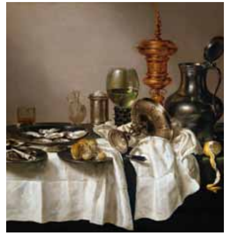
Willem Claesz Heda (1594-1680), stilleven met vergulde bokaal, 1635

In geschilderde bloemstilleven (in de zeventiende eeuw blompotten genoemd) zijn de bloemen los van hun natuurlijke omgeving geschilderd; sommige soorten uit het boeket komen in de natuur niet in elkaars buurt voor of bloeien niet gelijktijdig. Abraham Mignon (1640-1679) specialiseerde zich in blompotten; de bloemen worden afgebeeld vanwege hun schoonheid en symboliek. Op het afgebeelde stilleven is het gesloten zakhorloge een opvallende blikvanger. De tijd is even stilgezet. Deze natura morta , ofwel dit stilleven brengt de boodschap dat levensvreugde kortstondig is. Geniet ten volle van het moment en wees bewust van 's levens vluchtigheid. Festina lente , sed festina is een gezonde tegenhanger van de vanitassymboliek. Haast u langzaam; sta er bij stil, niet eindeloos, maar langer dan de negen seconden van de gemiddelde museumbezoeker.