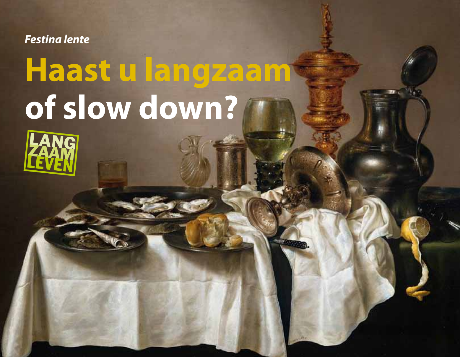
Willem Claesz Heda (1594-1680), stilleven met vergulde bokaal, 1635

Help ik ben verdwaald. Geef mij goede raad. Wie in deze door drukte en snelheid beheerste samenleving de weg dreigt kwijt te raken, kan het beste terugvallen op de in spreuken en gezegden neergeslagen kennis en wijsheid van vroeger tijden.