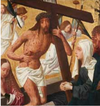
Geertgen tot Sint Jans, Christus als Man van Smarten, 1480-1490, Museum Catharijnenconvent, Utrecht

In de late middeleeuwen ontstond het zogenaamde 'Andachtsbild' zoals Christus op de koude steen, of Man van smarten; afbeeldingen als samenvatting van het lijdensverhaal waarbij men zich in rouw kon dompelen en mediteren over de futiliteit van het aardse bestaan.