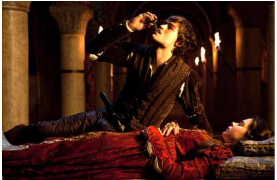
Romeo en Julia