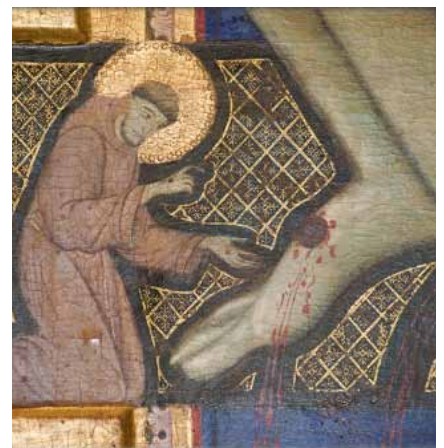
De maestro di San Francesco, crucifix, detail, Arezzo

In het eerste hoofdstuk van zijn wereldberoemde boek Herfsttij der middeleeuwen , beschrijft de historicus Johan Huizinga de bonte, hartstochtelijke levensvormen van de laatmiddeleeuwse maatschappij. 's Levens felheid, noemde hij het vaak irrationele en emotionele gedrag van de middeleeuwen. Passie in geloofsbeleving werd in gang gezet door Franciscus van Assisi door de twee betekenissen van het woord passie, lijden én hartstocht, bij elkaar te brengen. Hij leefde zich zo in het lijden van Christus in (compassie) dat diens kruiswonden op handen en voeten van de vrome Franciscus als stigmata verschenen.