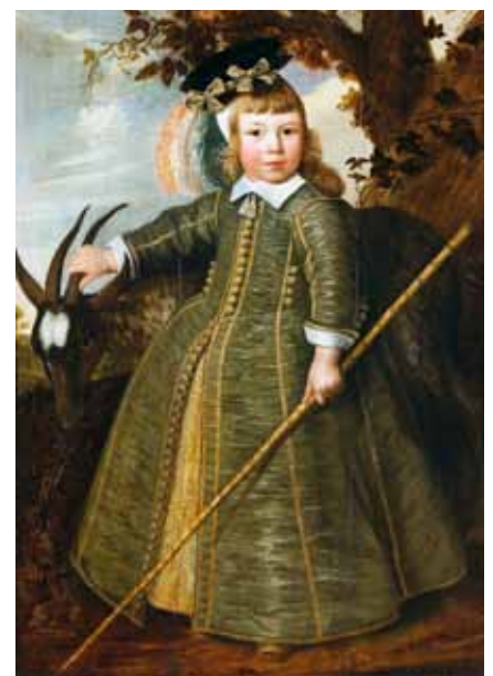
Jan Albertsz. Rotius, portret van jongetje met bok, 1652, Rijksmuseum Amsterdam

voornamelijk om die strijd. Onze voorouders waren vast niet minder hartstochtelijk dan wij, maar hielden er een ander persoonlijkheidsideaal op na: beheerst, berekenend, koel, onverschillig en vooral: standvastig. Voor vrouwen gold min of meer hetzelfde, maar zij werden geacht van nature hartstochtelijker te zijn en minder met rede begiftigd. Daarom werden zij onder heerschappij van de man gesteld, die beter in staat was zijn hartstochten, en dus ook de hare, te bedwingen. Men probeerde de rationalistische kritiek op de passies ook in het onderwijs in praktijk te brengen. Er verschenen veel traktaten over opvoeding van de jeugd, en natuurlijk liet vader Cats zich niet onbetuigd. Tucht baert vrucht , was zijn bondige typering van het wezen van de opvoeding.