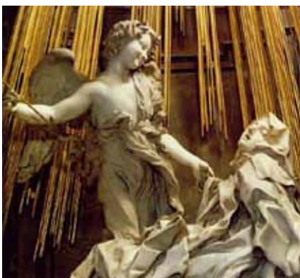
Gian Lorenzo Bernini, De Extase van St. Theresa, 1645-52, marmer, Coranarokapel, Sta. Maria della Vittoria, Rome

Hartstochtelijke gevoelens waren geaccepteerd binnen het christelijk geloof mits gericht op wereldverzaking en soberheid. De extatische passie van mystici was immers een gevolg van rigide ascese. Door jezelf aardse geneugten te ontzeggen, word je ontvankelijk voor het hogere. De zeventiende-eeuwse beeldhouwer Bernini beeldde de heilige Theresa van Avila af terwijl ze in extase raakt omdat haar hart wordt doorboord met Goddelijke Liefde.