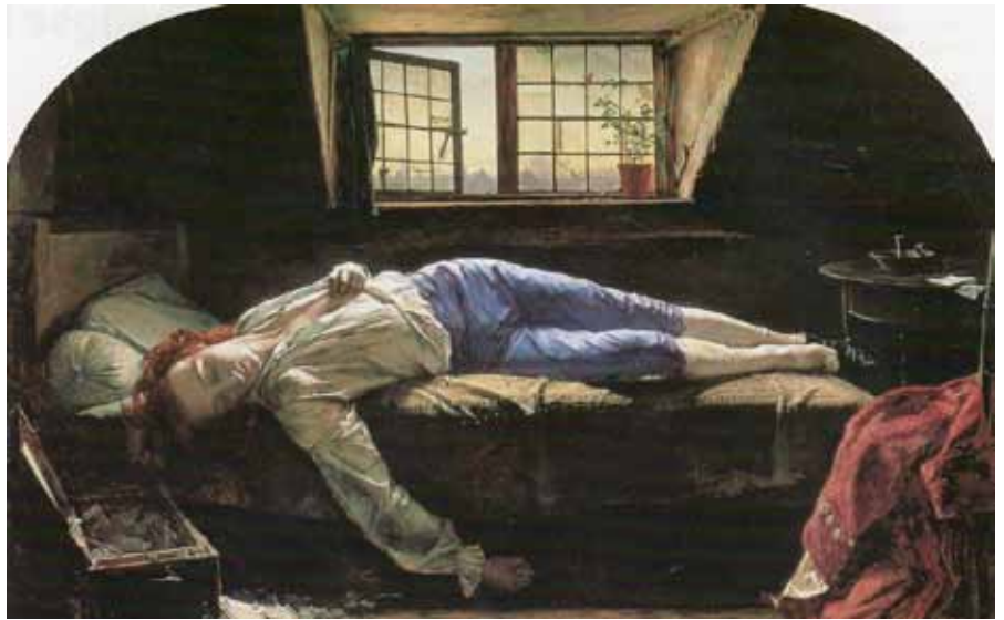
Henry Wallis, Chatterton , 1865, Tate Gallery, London